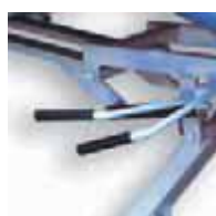
Palanca de gases para movimientos