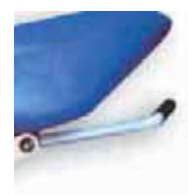
Palanca de gases para movimientos